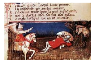
La Canción de Roldán