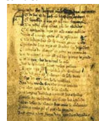
Reproducción del Cantar del Mío Cid del siglo XV