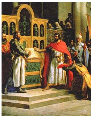
Representación del juramento de Santa Gadea ante Alfonso VI

La responsable de esto es la escultora norteamericana Anna Hyatt Huntington (1.876-1.973). Esta señora erigió cinco de las estatuas más conocidas de El Cid. Tres de ellas se localizan en Estados Unidos (San Diego, San Francisco y Washington), la cuarta en Buenos Aires, y la quinta y más cercana a nosotros la de Sevilla. Otros lugares españoles donde podemos admirar la figura de este personaje legendario son: Burgos, Valencia, El Poyo del Cid (Teruel) y en su pueblo natal, Vivar del Cid (Burgos).