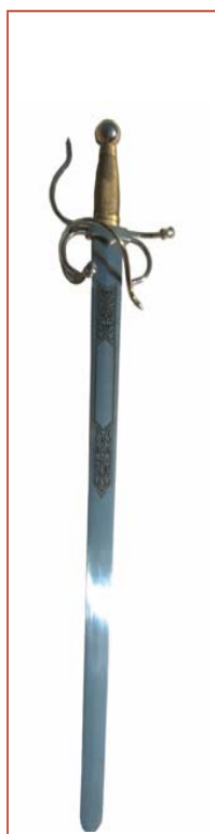
TIZONA, UNA DE LAS ESPADAS DEL CID